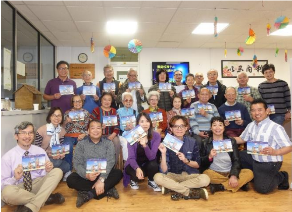
人月團圓 神人和好 中秋蒙福 耶穌愛你

我們在9月17日周二同行小組歡度了中秋節慶祝, 這裡有很多我們的共同回憶, 多少的歡笑和淚水, 感覺這裡就是神為我們預備的家! 耶穌基督為世人贖罪, 使斷絕的關係再次接通, 反仇成睦, 求主使用我們成為和平使者, 福音橋樑。吸引更多沉迷賭博的人與神和好從賭徒成為門徒, 經歷與人與神的團圓